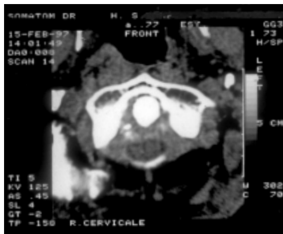
Figura 2b - Tomografia assiale computerizzata: l'immagine tomografica un po' più caudale rispetto alla precedente (livello C1-C2) evidenzia dislocazione e compressione del midollo da parte del tessuto finemente calcificato situato posteriormente al processo odontoideo.