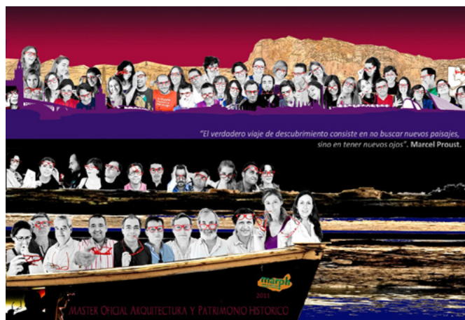
La promoción del marph-11 según los propios estudiantes. Galería de retratos

Una diversidad en el alumnado ha ayudado a configurar, edición tras edición, una identidad característica del MARPH, en gran medida gracias a un proyecto docente articulado de forma diferenciada y novedosa respecto a otros posgrados en patrimonio, constituyendo toda una