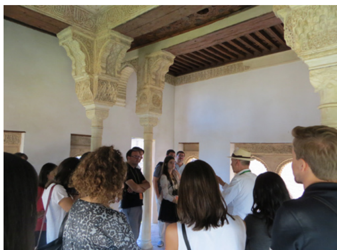
Estudiantes del marph-14 visitando el Peinador de la Reina de La Alhambra

generación de patrimonialistas. Dirigido tanto a la formación de recién titulados como al perfeccionamiento y reciclaje de todos los profesionales, públicos y privados intervinientes en patrimonio, el MARPH ha desarrollado un modelo docente con una personalidad propia, que posibilita que lo cursen titulados de muy diversos perfiles y procedencias. Se forma en cada promoción un colectivo intergeneracional que se beneficia del trabajo interdisciplinar, abordando tareas especialmente complejas desde el primado de la excelencia, la actualidad y proyección de futuro en el campo de atención a los bienes culturales integrantes del patrimonio histórico.