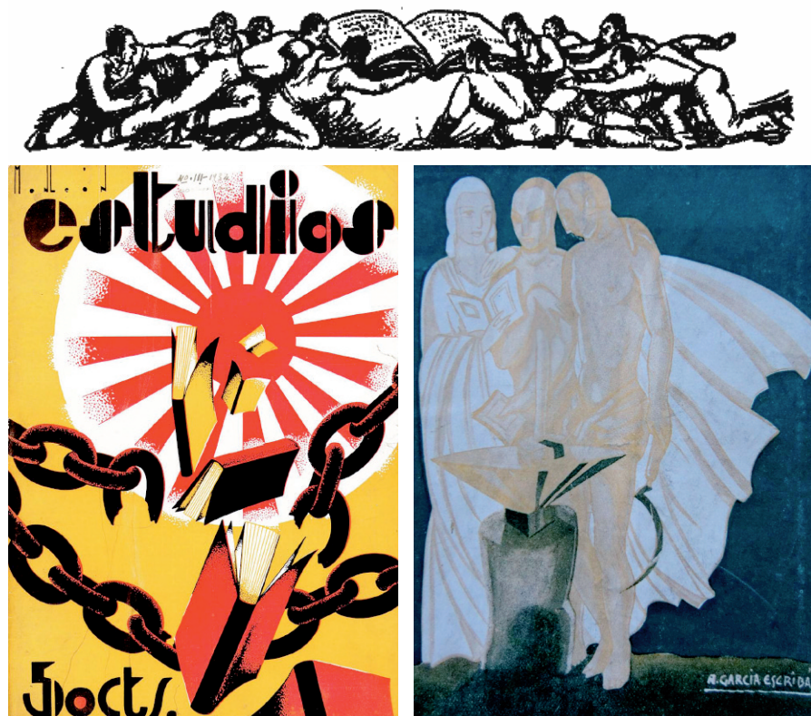
Representaciones de la veneración anarquista por el libro, por su carácter revolucionario y esencia del cambio social (Arriba: 1. La Revista Blanca , 378, 17-04-1936). Abajo izquierda: 2. Estudios , Nov-1932. Abajo derecha: 3. RELGIS, 1932

cos espacios de sociabilidad insertos en la tradición decimonónica anterior, ligada a la difusión del racionalismo y el liberalismo político. Al igual que los clubes republicanos y los centros de cultura, los ateneos se convierten en difusores de una enseñanza básica y superior, fomento de la ciencia y de círculos literario-artísticos que insertan al obrero en dinámicas antes exclusivas de la elite burguesa. Esta labor alfabetizadora los convirtió de facto en alternativa a las escuelas estatales, afianzando así su posición vertebradora como centros vivos del mutualismo obrero. Frente a una educación más rígida y tradicional, estos lugares permitían acceder libremente, no sólo a una educación más en consonancia con las reivindicaciones de estos sectores, sino a un material educativo que fuera de estas paredes era prohibitivo para muchos de sus miembros