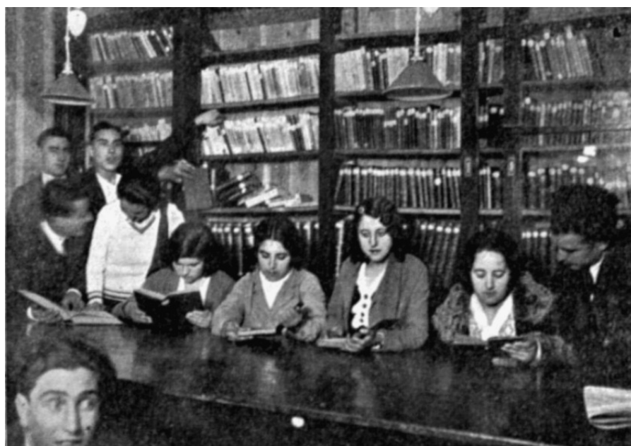
Arriba: 4. Biblioteca de la Asociación Cultural Libertaria Escuela Armonía de Barcelona ( ¡¡Campo!! , 29, 25-09-1937). Abajo: 5. Biblioteca del Ateneo Libertario de la barriada del Clot de Barcelona ( La Revista Blanca , 213, 01-04-1932)