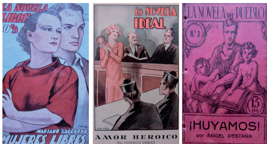
Representación de las portadas de "la novela libre", "la novela ideal" y "la novela del pueblo", las tres colecciones más representativas de la novelística moralista ácrata durante los años treinta (Izquierda: 6. Gallardo, Mujeres libres... , s.d., portada. Centro: 7. Urales, s.d., portada. Derecha: 8. Pestaña, s.d., portada

Este tipo de novelística libertaria pretendía ser una alternativa real a la literatura de consumo burguesa, muy consumidas pero criticadas por su falta de contenido crítico y denuncia social. Para el anarquismo, era una perversión convertir el arte de escribir en una profesión lucrativa que únicamente persiguiera satisfacer el ego personal. Éste debía servir para propagar la moral y la sociedad libertaria en toda su extensión ya que, fuera cual fuese la actividad desempeñada, el anarquismo siempre tenía presente que el fin de su lucha debía ser la instauración de una nueva sociedad (Litvak, 1981: 102-108; Navarro Navarro, 1997: 172; Gutiérrez Molina, 2001: 106-108) 18 .