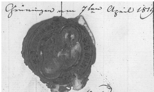
Abb. 3: Altes Stadtsiegel von Grünigen aus dem Brandversicherungskataster 1818-1880

Laufe der Jahrhunderte verloren gegangen. Aufgrund dieser Erkenntnisse dürfte die Verleihung der Stadtrechte zwischen 1397 und 1410 stattgefunden haben. 2