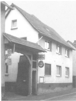
Abb. 15: Gaststätte „Zum Löwen“ in der Taunusstraße in Grüningen (1998)