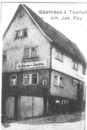
Abb. 12: Ausschnitt einer Postkarte mit der Fotografie des Gasthauses „Zum Taunus“ (Anfang 20. Jahrhundert)

Zunächst liegt der Verdacht nahe, dass sich im späten 18. Jahrhundert und im