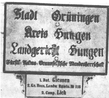
Abb. 2: Altes Ortschild Grüningens