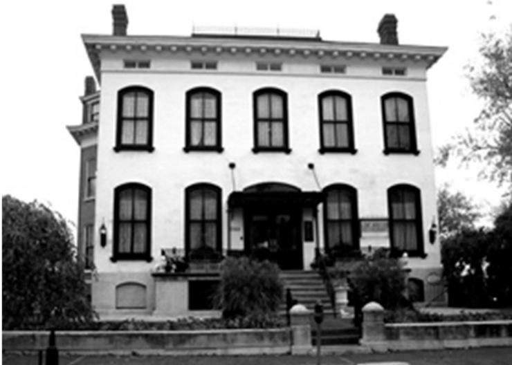
Abb. 1: Lemp Mansion in St. Louis/Missouri