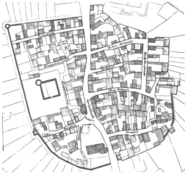
Abb. 9: Spätmittelalterlicher Ortsplan von Grüningen