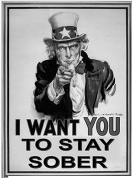
Abb. 17: Plakat zur Aufforderung zur Abstinenz in den USA