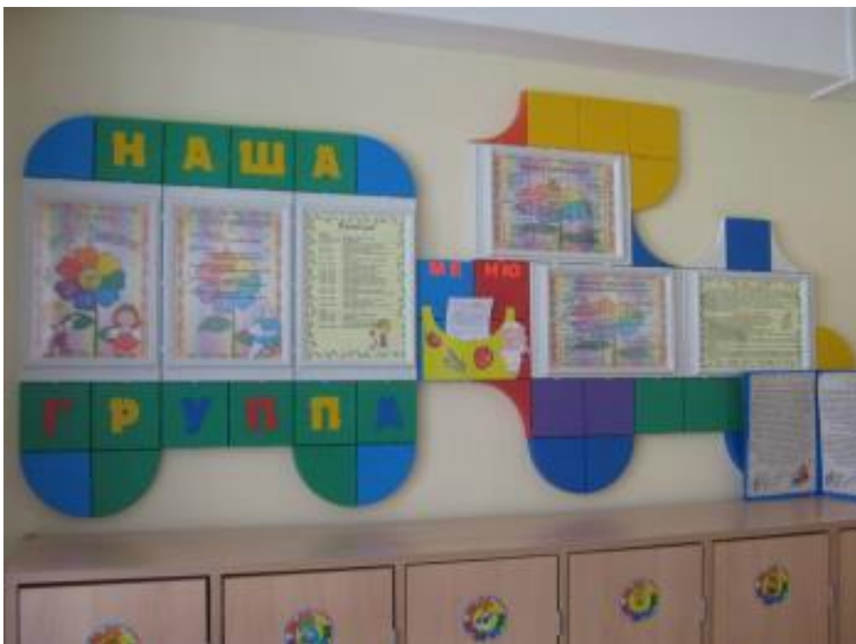
Рис. 1. Уголок для родителей в подготовительной группе МБДОУ «Детский сад № 244»

На стенде размещена справочная информация о правах ребенка, правилах личной безопасности, советы врачей, обязанности родителей.