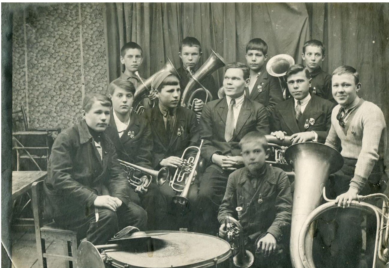
Духовой оркестр клуб им. Артема, 1930-е годы