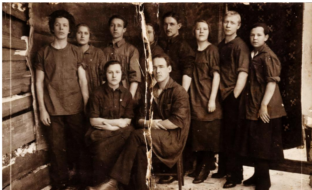
Участники живой газеты Синяя блуза при клубе им. Артема, 1927 год