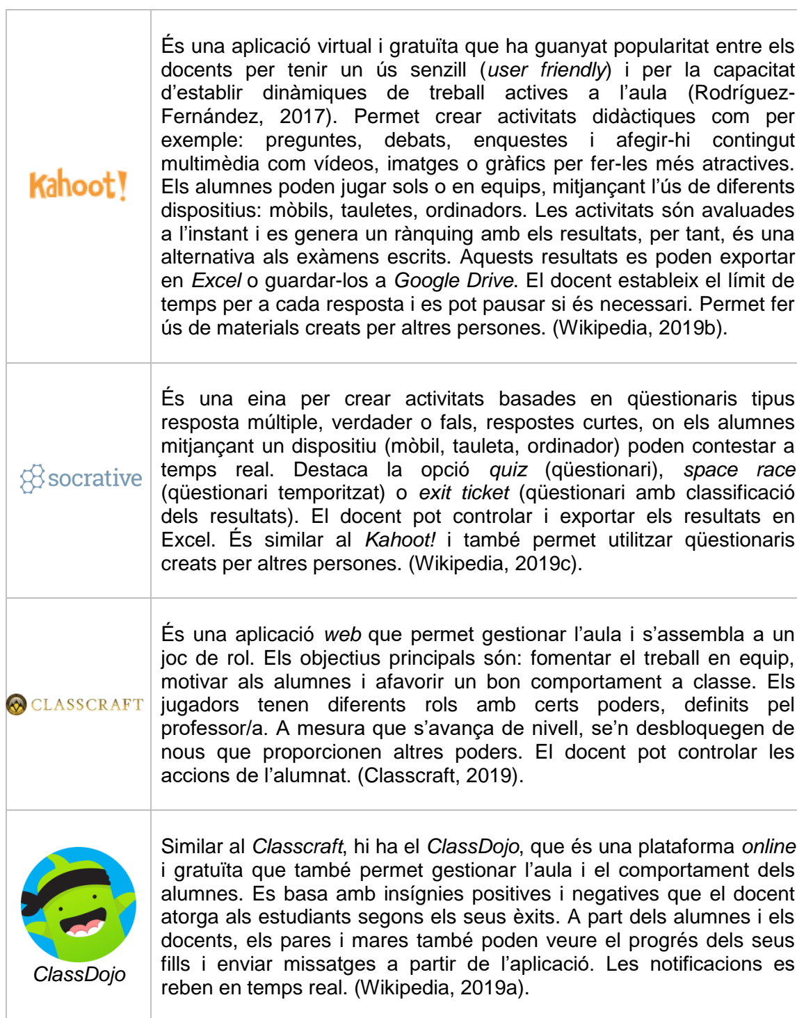
Taula 8. Eines per a la gamificació a l'aula.

Una altra opció és aplicar la gamificació a partir de mètodes més analògics, és a dir, no tecnològics, adaptant jocs de taula on els alumnes coneixen la seva dinàmica o bé amb formats tradicionals, i adaptar-los a una assignatura específica. Aquesta opció és bona en funció de quines habilitats tingui el docent, ja que al final es tracta de buscar