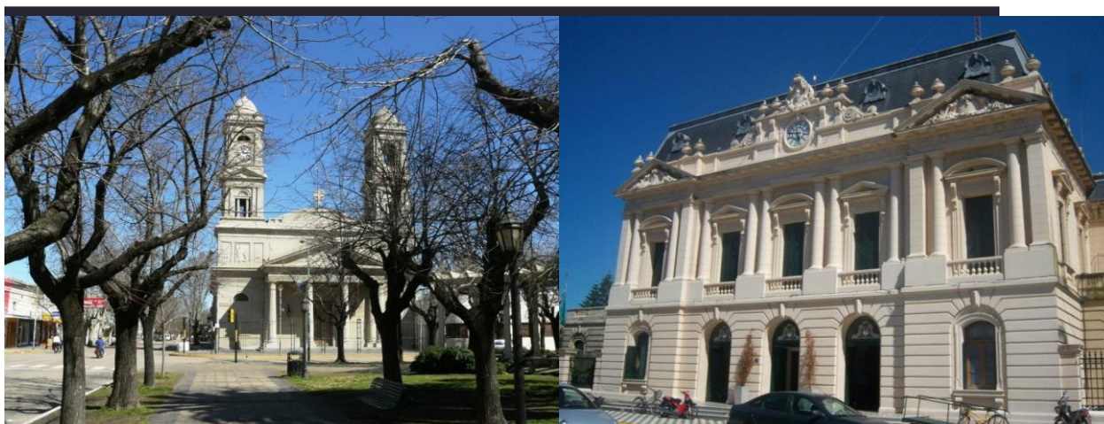
Bienes patrimoniales públicos e institucionales.