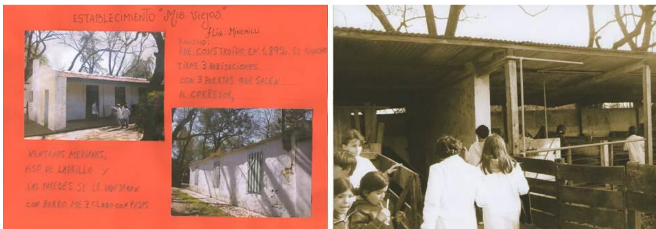
Trabajos de las escuelas rurales sobre visitas a las estancias de su localidad (2010).

Si bien todos los directores de las 38 escuelas públicas de Chacabuco recibieron las orientaciones y sugerencias pertinentes, según las necesidades específicas, no todos los establecimientos realizaron proyectos con este tipo de enfoque [8]. No se tiene conocimiento sobre la realización de proyectos de esta naturaleza en otros partidos de la provincia, pero se sabe que durante el presente año la Escuela Privada Madrigal, inició un proyecto semejante en el que visitarán la Estancia La Criolla, lugar donde comenzó a funcionar el primer Juzgado de Paz de Chacabuco