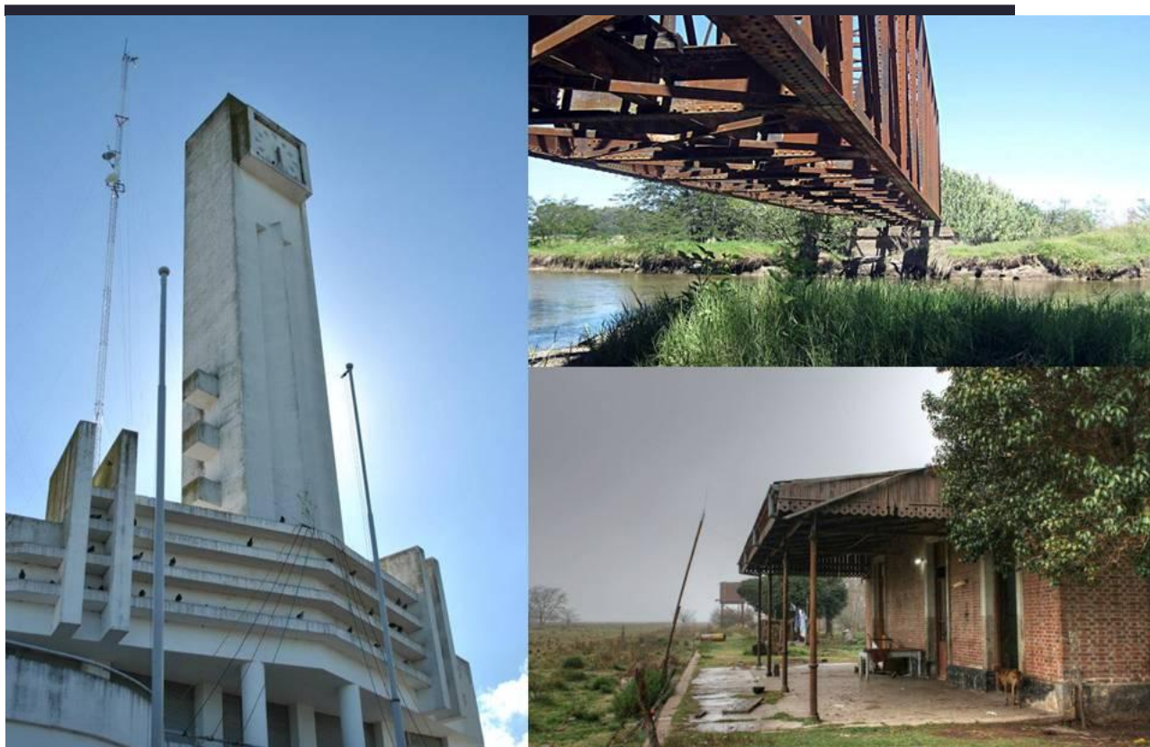
Arquitectura patrimonial de los pueblos de la región NOBA.