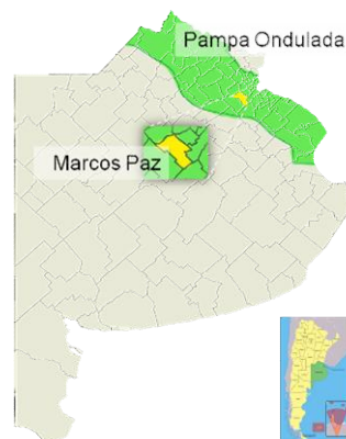
Figura 1. Sitio de estudio

El estudio se llevó a cabo en un establecimiento agrícola-ganadero de la Provincia de Buenos Aires, en la región Pampa Ondulada (Figura 1). El mismo tiene una capacidad para 12000 animales por ciclo productivo y cuenta con 34 corrales de engorde. El estiércol removido anualmente de la superficie de los corrales se dispone en pilas sobre un campo agrícola, y luego de un tiempo de degradación al aire, es desparramado con el fin de mejorar la fertilidad edáfica. El resultado de estas acciones antrópicas no han sido monitoreadas, siendo el campo agrícola con alta carga de estiércol el foco de este estudio.