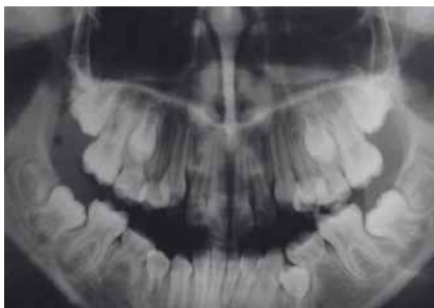
Figura. Radiografía panorámica de paciente de 8 años de edad, del sexo femenino, que no refiere antecedentes médicos de interés Al hacer la evaluación radiológica se muestra la ausencia de formación del germen dentario de los segundos premolares inferiores.

La agnesia es la anomalía dentaria más frecuente y se caracteriza por la ausencia de una o más piezas dentarias. Su etiología aún no está totalmente esclarecida; sin embargo, el componente genético es importante. La prevalencia de la agnesia de segundos premolares ocurre con mayor frecuencia en pacientes del sexo femenino y puede traer consecuencias, como molares deciduos anquilosados, infraoclusión de estos dientes, extrusión del diente antagonista, inclinación de los primeros molares permanentes, aumento de espacios libres y desarrollo reducido del proceso alveolar. Antes de realizar cualquier tratamiento, se debe estar atento a la posibilidad de formación tardía de los premolares, un diagnóstico confiable puede ser realizado por medio de la radiografía panorámica luego de los ocho años de edad. El manejo terapéutico puede ser la conservación o la extracción del molar deciduo. Esto dependerá de las características, necesidades y posibilidades de tratamiento, incluyendo: tratamiento ortodóntico, intervenciones restauradoras o planificación para la colocación de implantes.