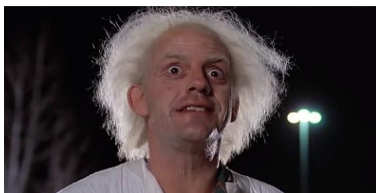
Figura 8. Christopher Lloyd pone voz a Hacker (en la imagen, en Regreso al Futuro , Zemeckis, 1985).

Los errores de doblaje que se cometen en el episodio de Cyberchase que hemos analizado echan por tierra sino todo, sí al menos parte del trabajo de los guionistas y de los expertos que contribuyeron al mismo. Sería deseable que, en las tareas de doblaje se contase con la colaboración de un experto en educación matemática, o del ámbito en cuestión, al igual que en la producción de los episodios. En cualquier caso, siempre podemos verla en versión original. De esta forma, no nos perdemos a los actores que ponen voz a Digit y al villano Hacker; Gilbert Gottfried y Christopher Lloyd, respectivamente. Sí, Doc, estimación no es exactamente lo mismo que cálculo (Figura 8).