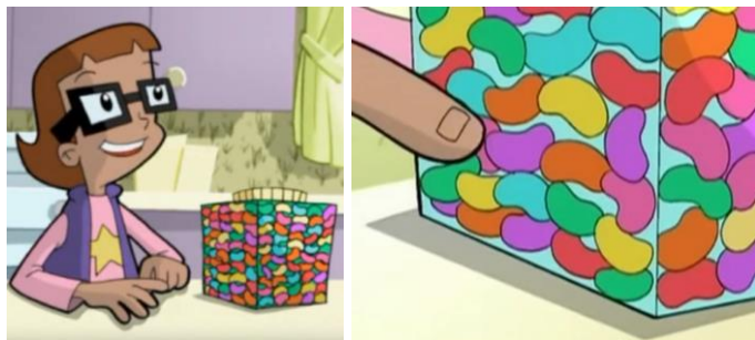
Figura 5. Inez, estimando al final del episodio ( Cyberchase , episodio 1x04, Un día nevado para ser exacto ).

Los capítulos, en su versión original, continúan con un pequeño vídeo grabado con actores reales, bajo el título For real . El que incluye este episodio, Regards to Broadway , plantea una situación cotidiana que puede abordarse con las técnicas de estimación vistas en la aventura vivida por Inez, Matt y Jackie. El personaje real, Will, está en Broadway y quiere ver un espectáculo. La taquilla cerrará a las seis en punto, por lo que, echando un vistazo a su reloj, Will se percató de que quedan apenas 21 minutos para ello. Debe tomar una decisión: o quedarse en la cola y confiar en que llegará a tiempo para comprar una entrada a precio reducido (quizás), o cambiar de acera y comprar una entrada a precio normal para algún espectáculo que empiece ya (seguro). El problema es que, si espera demasiado, puede que se quede sin ambas opciones. Necesita, por tanto, una manera de averiguar si la cola avanza lo suficientemente rápido. Y para eso hará uso de la estimación, observando que se tarda unos cinco minutos en recorrer una baldosa. Se da cuenta de que con cuatro baldosas ya emplearía 20 minutos y, siendo evidente además que la cola no termina ahí, decide no malgastar su tiempo y comprar una entrada más cara en otro sitio.