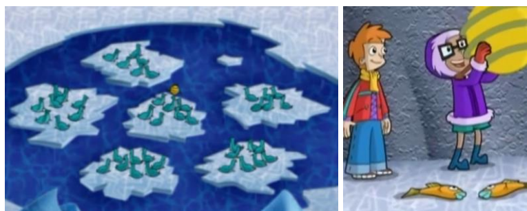
Figura 4. Estimando el número de focas (Cyberchase, episodio 1x04, Un día nevado para ser exacto ).

De nuevo tenemos la cuestión del doblaje. Todo el empeño de los diálogos originales en remarcar que la estimación es algo aproximado se pierde cuando Inez dice que "hay el mismo número de focas en cada uno". La versión original utiliza otros términos: "there's about the same number of seals on each piece". Ese about lo es todo en esta situación, pues es lo que la diferencia de otras en la que sí que se podría calcular la cardinalidad de manera exacta. Además, es evidente que no todos los trozos tienen ocho focas. Un detalle interesante que refuerza la idea de que la estimación proporciona un resultado aproximado es que, cuando terminan de darles de comer, se observa cómo les sobran un par de peces (Figura 4).