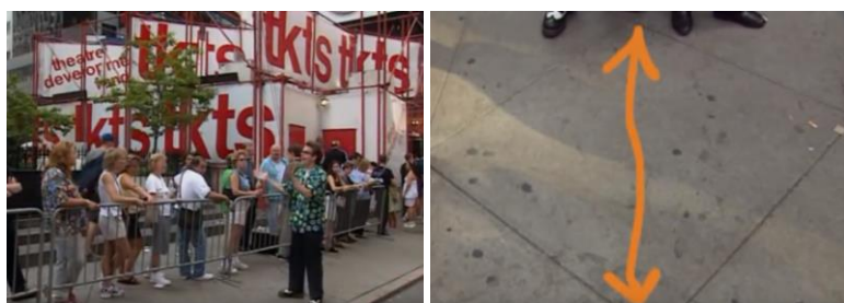
Figura 6. Fragmento For real , en el que se aplica la estimación en una situación cotidiana ( Cyberchase , episodio 1x04, Un día nevado para ser exacto ).

Los capítulos, en su versión original, continúan con un pequeño vídeo grabado con actores reales, bajo el título For real . El que incluye este episodio, Regards to Broadway , plantea una situación cotidiana que puede abordarse con las técnicas de estimación vistas en la aventura vivida por Inez, Matt y Jackie. El personaje real, Will, está en Broadway y quiere ver un espectáculo. La taquilla cerrará a las seis en punto, por lo que, echando un vistazo a su reloj, Will se percató de que quedan apenas 21 minutos para ello. Debe tomar una decisión: o quedarse en la cola y confiar en que llegará a tiempo para comprar una entrada a precio reducido (quizás), o cambiar de acera y comprar una entrada a precio normal para algún espectáculo que empiece ya (seguro). El problema es que, si espera demasiado, puede que se quede sin ambas opciones. Necesita, por tanto, una manera de averiguar si la cola avanza lo suficientemente rápido. Y para eso hará uso de la estimación, observando que se tarda unos cinco minutos en recorrer una baldosa. Se da cuenta de que con cuatro baldosas ya emplearía 20 minutos y, siendo evidente además que la cola no termina ahí, decide no malgastar su tiempo y comprar una entrada más cara en otro sitio.