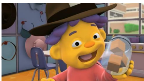
Figura 7. Sid el niño científico (episodio 103, Enough With the Seashells! )

También encontramos estimación en Sid el niño científico (Sid the Science Kid) , serie producida entre 2008 y 2013, por la compañía Jim Henson, distribuida por PBS y orientada a un público propio de la educación infantil. En España, Netflix estuvo emitiéndola hasta abril de 2018 y, en el episodio 103, ( Enough With the Seashells ), Sid pregunta por el número de objetos que hay en un tarro, y habla en términos de estimación. Ahora bien, en la Figura 7 se observa que la cardinalidad del conjunto es tres, visible con facilidad, pues el protagonista se preocupa de proporcionar diferentes puntos de vista. Se trata, más que de una situación de estimación, de una de subitización. En relación con esto, resulta interesante el estudio de Revkin, Piazza, Izard, Cohen y Dehaene (2008), quienes aportan evidencias que parecen indicar que la estimación no es el mecanismo subyacente de la subitización, dejando abierta la cuestión de si la subitización se apoya en procesos cognitivos generales o específicamente numéricos.