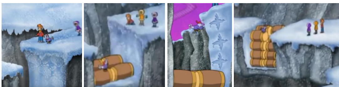
Figura 3. Estimando los barriles que hacen falta para llenar el hueco hasta el fondo del precipicio ( Cyberchase , episodio 1x04, Un día nevado para ser exacto ).

MATT: Faltó poco, aquí hay un enorme hueco en el hielo. INEZ: ¿Qué profundidad tiene? MATT: No lo sé, pero es muy ancho para saltarlo. Y no podemos rodearlo. JACKIE: ¿Y si lo rellenamos con algo? INEZ: Buena idea, Jackie, tal vez haya algo en aquella cabaña.