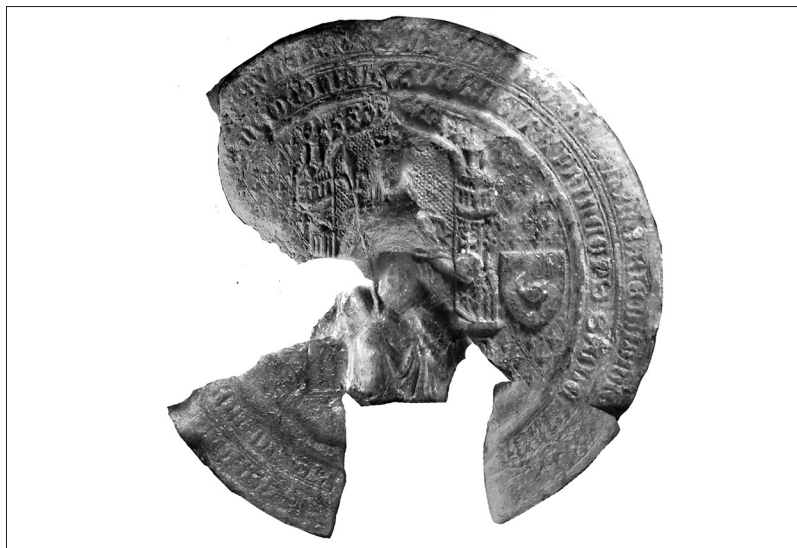
Mária-pecsét – 1388