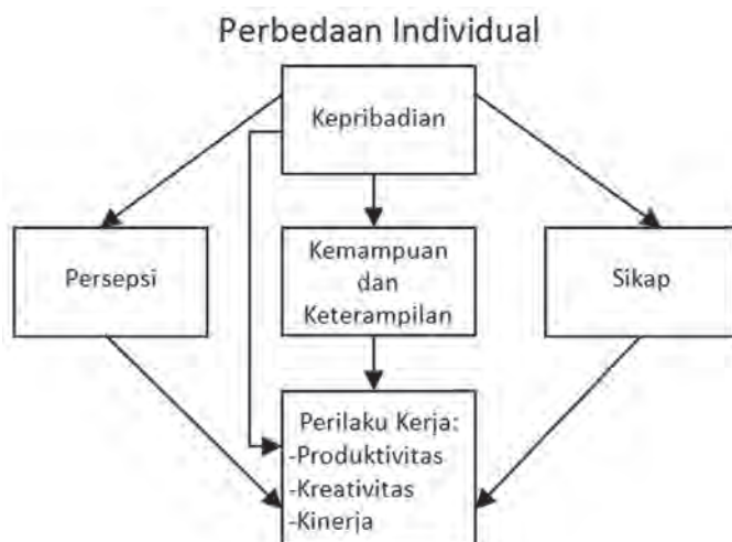
Gambar 2 Perbedaan Individu di tempat kerja

Dalam melaksanakan pekerjaan, perilaku kerja karyawan bergantung pada lingkungan pekerjaannya, Ivancerich (2007:83). Perilaku kerja seseorang dipengaruhi oleh berbagai faktor, sebagaimana ditunjukkan pada gambar 2.