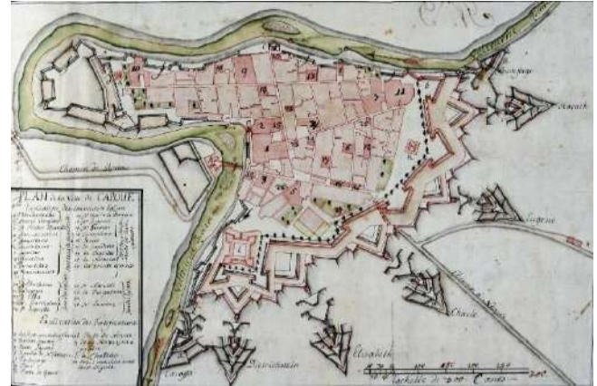
Fig. 2 Plan de la Ville de Capoue, 1729.

Durante el Virreinato austriaco, en las primeras décadas del siglo XVIII, las murallas de la ciudad fueron modernizadas, para crear una defensa cada vez más avanzada (Granata 1756, p. 290), confirmando el papel de la ciudad de Capua como fortaleza de importancia primordial para la defensa de territorio sureño. Para la racionalización de la estructura