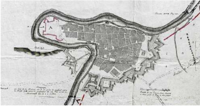
Fig. 1 Descripción del estado actual de la Plaza de Capua, 1720 ca. (Viena, Archivo de la Guerra, KV 494 E)

por las autoridades del Virrey, inadecuadas a la continua evolución de las técnicas de defensa y en 1552 se preparó la construcción de un frente más articulado con cinco bastiones, diseñado por F. Manlio y dirigido por A. Attendolo (Di Resta 1985, p. 55; Pignatelli 2008, p. 172).