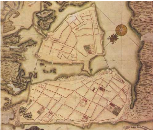
Fig. 1 Plano de la Ciudad de Cartagena de las Indias por Juan de Herrera y Sotomayor, part., 1730

Fue el ingeniero italiano Bautista Antonelli que inició la construcción de las murallas y fortificaciones de Cartagena de Indias, como el baluarte de Santo Domingo en 1614 entre otras. Su hijo Juan Bautista Antonelli, apodado "El Mozo", continuó la obra junto a su primo, el ingeniero hispano-italiano Cristóbal de