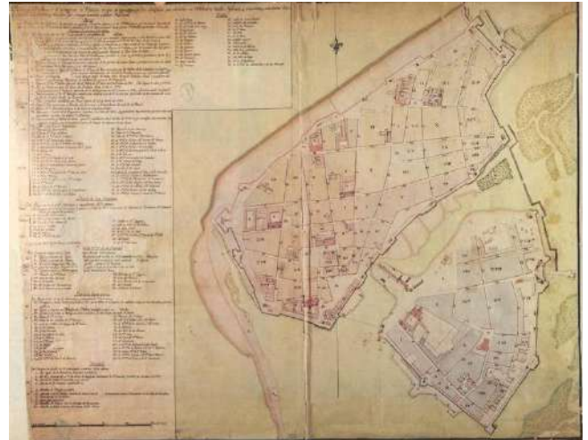
Fig. 4 Plaza y Arrabal de Cartagena de Indias en que se representan los Barrios. Plano realizado por el ingeniero militar Manuel de Anguiano, 1804 (Servicio Histórico Militar, Archivo General de la Nación, Bogotá, Colombia)

De lo anterior, surge que los sistemas defensivos de las ciudades fundacionales del nuevo mundo español, realizados de acuerdo con las técnicas militares más actualizadas, en el siglo XVI, no se actualizaron constantemente en los siglos siguientes, en realidad no se adecuaron a las innovaciones introducidas en Europa en el siglo XVII y, sobre todo, en el siglo XVIII. La influencia de la cultura española en los diferentes territorios del mundo nos demuestra un enfoque muy poco disponible para el diálogo con las culturas locales y al mismo tiempo muy impositivo por su ideología y acciones prácticas. Sin dudas las experiencias constructivas en el campo de la arquitectura militar han