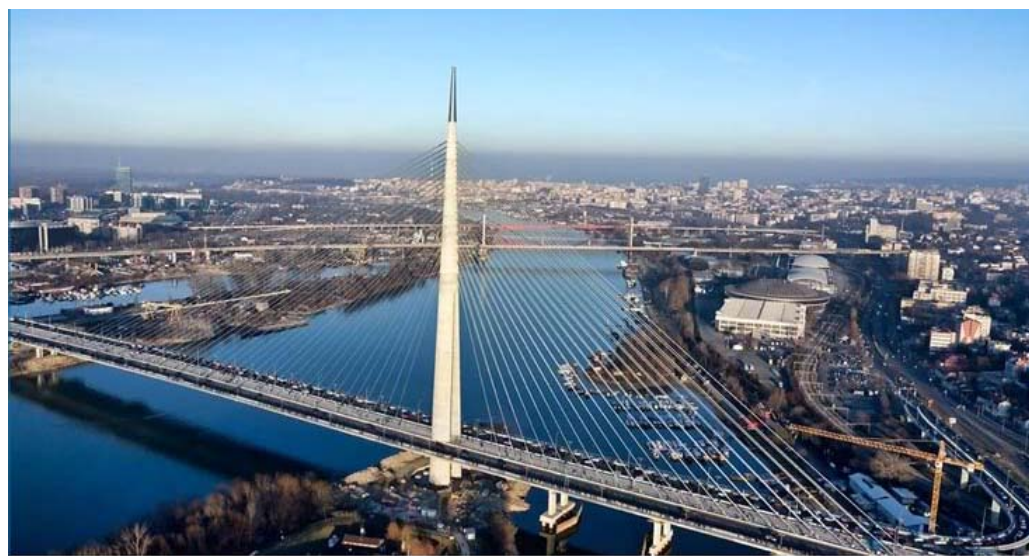
Слика 2. Мост на Ади преко реке Саве