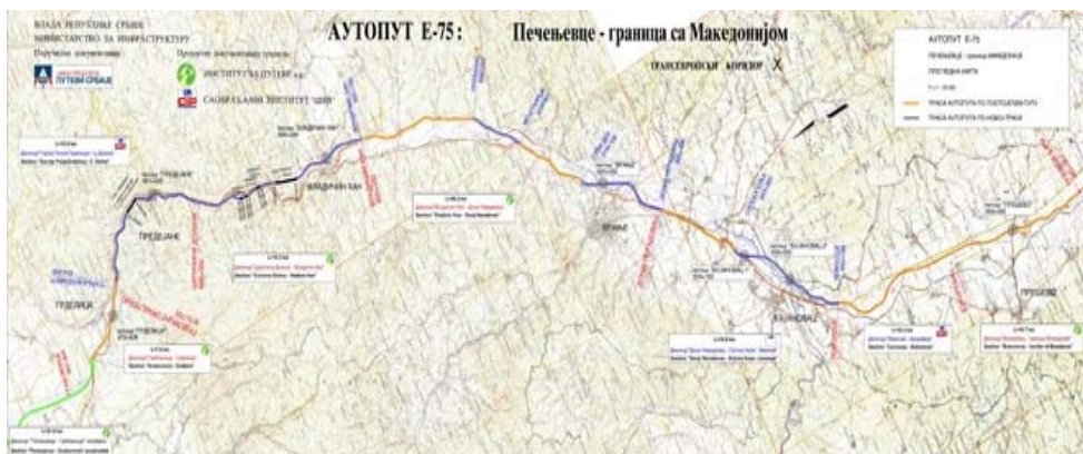
Slika 5 – Karta autoputa E-75 na Koridoru X u izgradnji