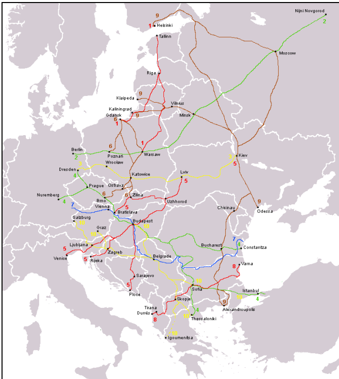
Slika 1 – Karta panevropskih koridora

Vlada Srbije je još 2008. godine donela odluku o izgradnji preostalih deonica autoputa na Koridoru X na teritoriji Republike Srbije. Koridor X je jedan od svega 10 panevropskih saobraćajnih koridora, a za nas je najvažnijih jer prolazi kroz Srbiju i povezuje Austriju, Mađarsku, Sloveniju, Hrvatsku, Srbiju, Bugarsku, Makedoniju i Grčku. Osim Koridora X kroz Srbiju prolazi i Koridor VII (reka Dunav). Za razvoj Srbije od posebnog značaja je putni pravac E-763 koji povezuje Beograd i Južni Jadran. Radi ukazivanja na njegov značaj, ovaj pravac je simbolično nazvan "Koridor XI". Po Saobraćajnom masterplanu Srbije jedan od najvažnijih putnih pravaca, a koji je od značaja za razvoj područja u kome živi veliki broj stanovnika je i potez od Pojata do Preljine na E-761. Ovaj putni pravac je dobio simbolični naziv "Moravski koridor".