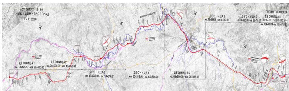
Slika 4 – Karta autoputa E-80 na Koridoru X u izgradnji