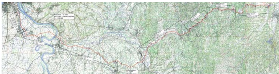
Slika 7 – Karta autoputa E-763 (Koridor XI) u izgradnji

Radovi na deonicama Obrenovac – Ub i Lajkovac – Ljig u ukupnoj dužini od 50km finansiraju se sredstvima Kineske EXIM banke, a izvođač radova je kineska firma China Shandong International Economic and Technical Cooperation Group LTD.