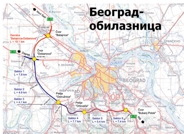
Slika6 – Karta autoputske obilaznice Beograda na Koridoru X u izgradnji