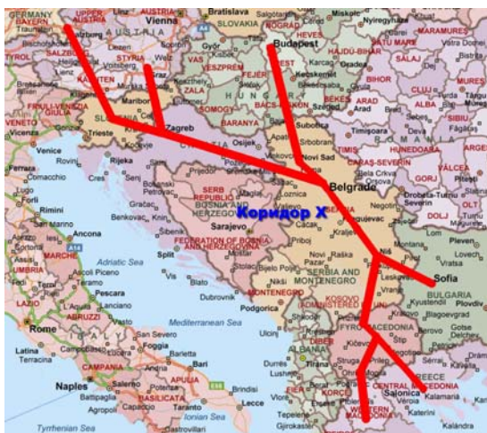
Slika 2 – Karta Koridora X