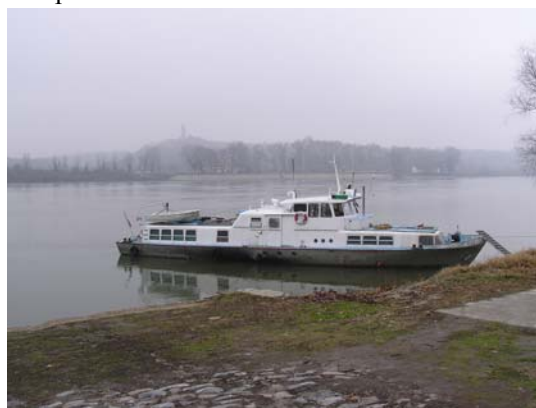
Slika 2 – Brod EHO

tim, zbog problema u realizaciji terenskih merenja prouzrokovanih lošim vremenskim uslovima (kiša, sneg) kao i zaraslosti tačaka vegetacijom, s obzirom da pojedinim tačkama nije bilo moguće pristupiti, projektovana geometrija je donekle izmenjena. Pojedine tačke referentne geodetske osnove Dunava kojima nije bio moguć pristup zamenjene su tačkama u njihovoj neposrednoj blizini. Takođe, i tačke državne trigonometrijske mreže, odnosno referentne mreže kojima se nije moglo pristupiti čak ni terenskim vozilom (zbog blata) zamenjene su pogodnim tačkama čiji je položaj bio podesniji za pristup.