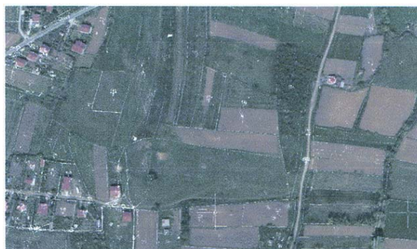
Слика 2. - Село Велика Моштаница – ортофото и катастарски план

Следећи корак била је процена ситуације у заједници. То подразумева процену потреба и могућности потенцијалних учесника у комасацији, као и процену социјалних, економских и еколошких могућности и ограничења за комасацију пилот подручја. У овој фази нарочито је било битно проценти стање постојећих катастарски података за Велику Моштаницу. Закључак је да су планови и алфанумерички подаци неажурни и нетачни. Ово се посебно односи на резиденцијални део, док је ситуација на пољопривредним подручјима нешто боља али ипак не задовољавајућа (слика 2).