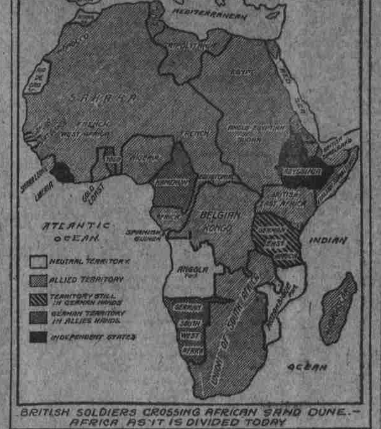
BRITISH SOLDIERS CROSSING AFRICAN SAND DUNE.—PRIOR AS IT IS DIVIDED TODAY

The taking of the Kamerun by the British leaves German East Africa as the only remaining German possession in Africa.