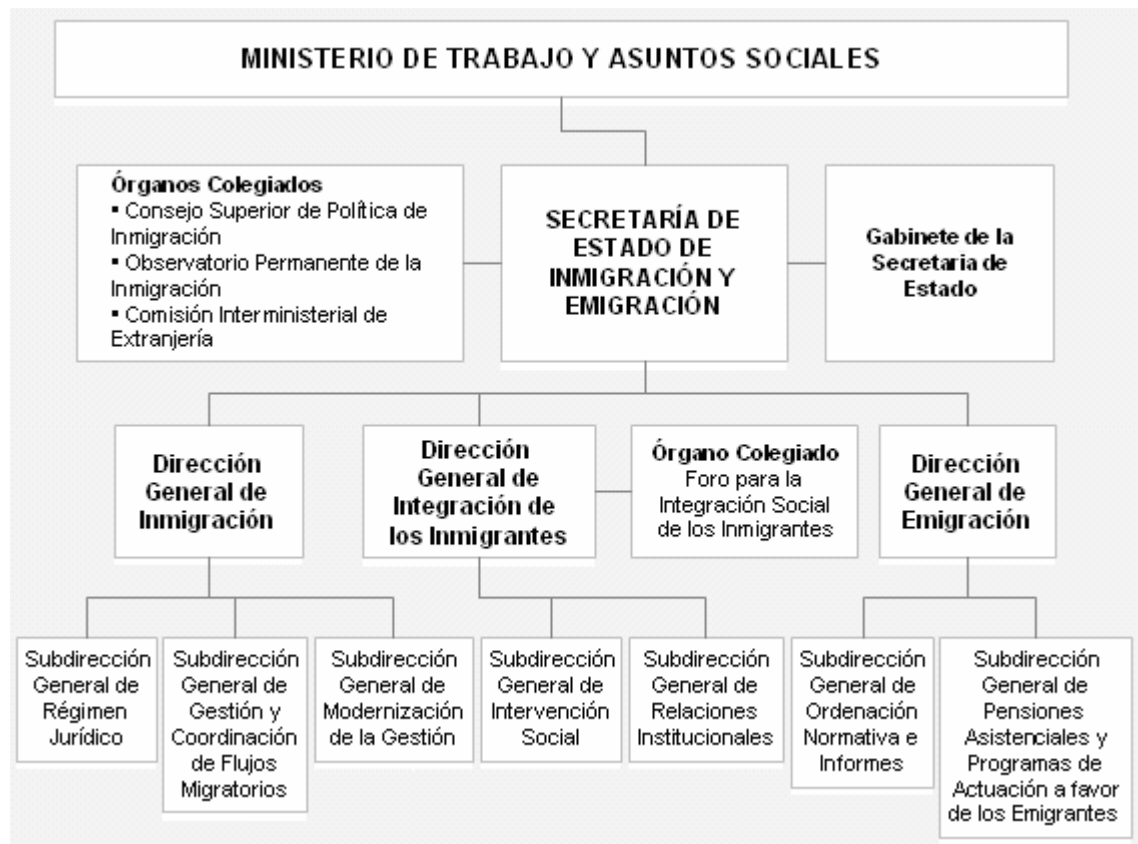
Figura 1. Organització de la Secretaria d'Estat de la immigració i emigració.