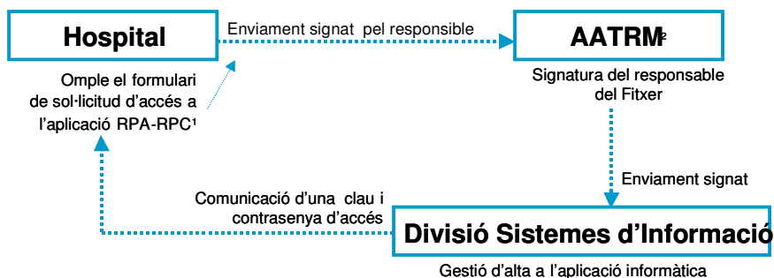
Figura 2. Accés dels usuaris al sistema informatitzat de dades

Els centres, a partir de la informació disponible en el seu sistema de informació, recopilen les dades necessàries pel RACat generant un fitxer amb l'estructura establerta des de la Divisió de Sistemes d'Informació. Des de l'AATRM es va proposar que la selecció inicial dels pacients es fes a partir del CMBDAH fent servir els codis 81.51 al 81.55. A partir d'aquests pacients seleccionats els centres han d'obtenir la informació sobre les pròtesis implantades i la lateralitat a les bases de dades corresponents. Les fonts d'informació que finalment es fan servir depenen de les característiques del sistema d'informació del centre. En aquells casos a on la informació no està disponible al Sistema d'Informació del centre una persona designada pel propi centre és l'encarregada d'obtenir la informació que és introduïda directament a la base de dades del RACat.