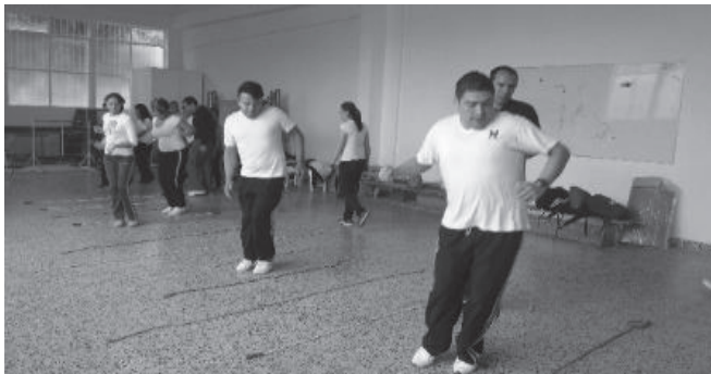
Imagen 2. Desarrollo de tutoría presencial de los estudiantes de VIII semestre.