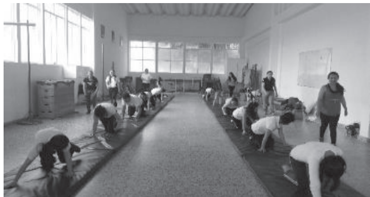
Imagen 1. Desarrollo de tutoría presencial de los estudiantes de VII semestre.