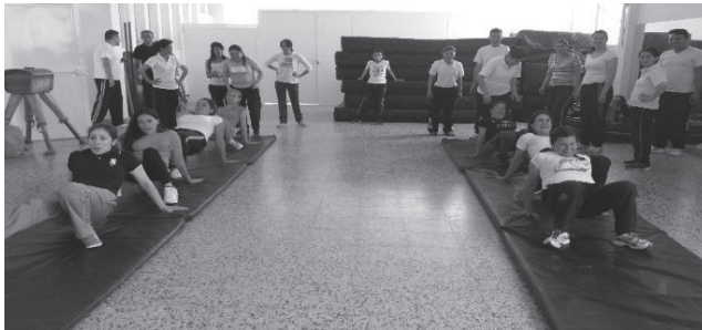
Imagen 3. Desarrollo de tutoría presencial de los estudiantes de VII semestre.

A medida que los estudiantes desarrollan las tutorías y las actividades planteadas en el aula virtual van adquiriendo los conocimientos necesarios los cuales les dan pautas para poder avanzar en el proceso de formación.