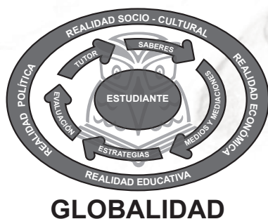
Figura 1: Estructura del Modelo Pedagógico de la Licenciatura en Educación Básica