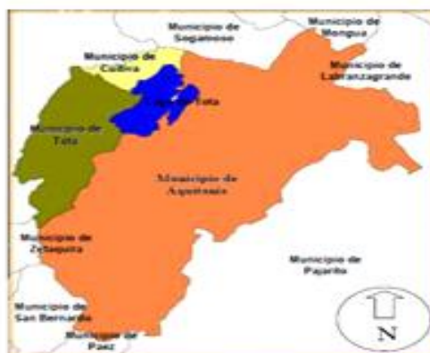
Figura 2. Límites de la Cuenca del Lago de Tota