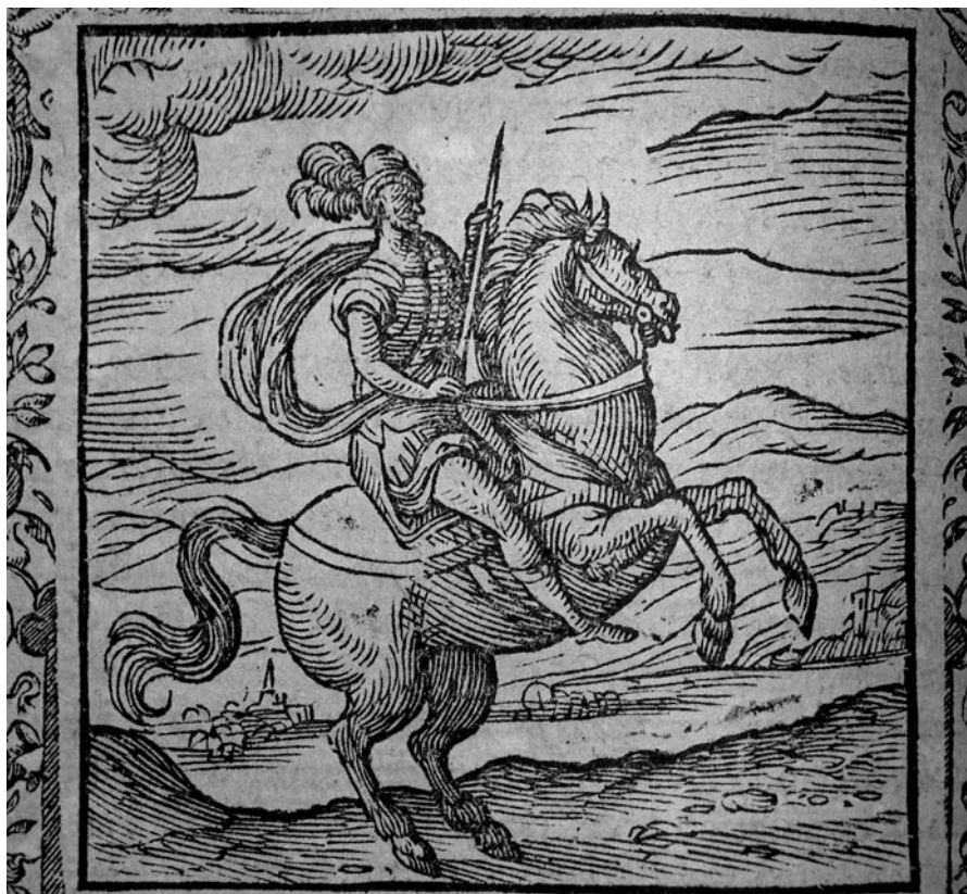
In adulari nescientem, emblemata xxxv tratto dagli Emblemata di Andrea Alciati.

ficando in tal modo la possibilità di controllare gli istinti peggiori 57 .