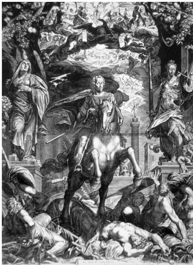
EGIDIUS SADELER, Trionfo dell'imperatore Ferdinando II (incisione).

strazione dei quali può essere segnalato il Trionfo dell'imperatore Ferdinando II , eseguito nel 1629 da Egidius Sadeler 36 .