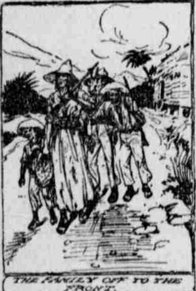
THE FAMILY OFF TO THE FRONT

It happens this way: One of the civil wars, which are the normal feature of politics in these countries, is in progress and there is an urgent demand for troops by government and revolutionists alike. Both sides stick