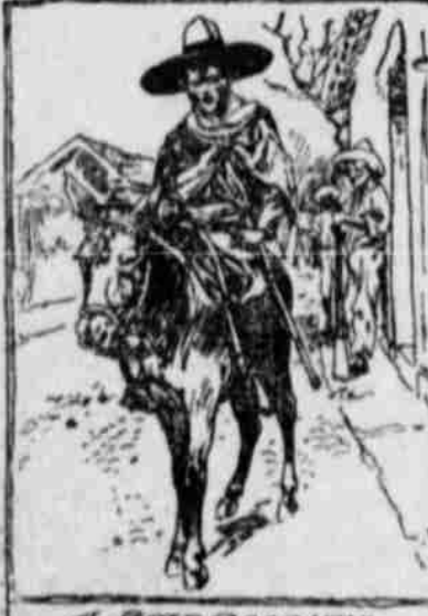
A BOY SOLDIER

discordant rattle of kettle-drums, an encircling shriek from the files and the army swung round the corner and screeched up the street past my hotel.