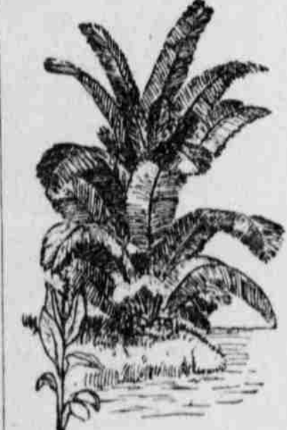
Tagua Palm (Vegetable Ivory) on the Magdalena River.

These family troops are sometimes guilty of terrible atrocities and the boys and the women are often worse than the men. It is not unusual for a lad of 14 or 16 to be made an officer if he has distinguished himself in battle, or happens to be related to the president. One of the most noted