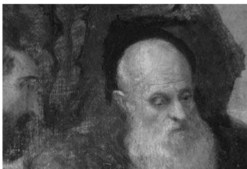
3-5. Paolo Veronese, Deposizione di Cristo (cat. 1), dettagli in riflettografia IR.

a pennello (come nel Cristo mostrato al popolo e nel più tardo dipinto con i Santi Taddeo e Francesco di Paola , dove però, nel primo caso, alcuni passaggi presentano tratti più sottili e nervosi), 8 mentre in altri casi è riscontrabile una situazione mista come quella del Ritratto di Paolo Cartolari (ovvero tratti brevi e precisi come nell'occhio destro, forse delineati a carboncino o a spolvero utilizzando cartoni di riporto e altri eseguiti probabilmente a pennello con esiti più morbidi, come nel caso dell'architettura del fondo e della definizione della parte destra del volto).