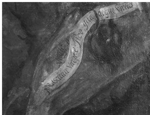
8. Paolo Farinati, I santi Taddeo e Francesco di Paola (cat. 10), dettaglio del masso centrale in riflettografia IR.