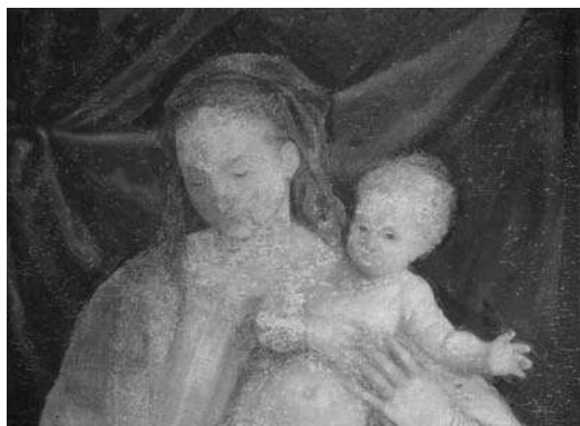
1-2. Paolo Veronese, Pala Bevilacqua Lazise (cat. 3), dettagli in riflettografia IR.

preparatorio della collezione Chatsworth e con il bozzetto ad olio degli Uffizi 7 . Giunge in aiuto la radiografia eseguita nel 1979 in occasione del restauro (e documentata in Veronese e Verona 1988, p. 190, fig. 3) nella quale si rilevano le modificazioni che hanno interessato la figura del Battista nel braccio che regge la croce (ovvero, in origine, la mano era spostata verso il santo vescovo, fig. 2, come, del resto, è testimoniato nel bozzetto) e nel ginocchio destro che, nella prima versione, non era a terra ma sollevato. Tra gli altri cambiamenti in corso d'opera si ricordano inoltre le figure emerse nell'analisi all'IR in una delle scene delle Storie di Ester (ovvero nell'episodio della Punizione degli Eunuchi ) dove, inizialmente, nel corteo erano previsti dei personaggi (dei quali è leggibile un leggero disegno, di puro contorno) poi non effettivamente realizzati; lo spostamento dell'uomo barbuto nella Deposizione di Cristo (fig. 5) per scoprire, infine, come nella prima versione della Deposizione con monaca , san Giovanni non indossasse il mantello (cat. 4, fig. 1).