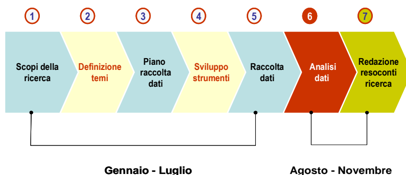
Figura 1 – Fasi della ricerca

Una specificità di questo contesto è costituita dalla compresenza di soggetti (istituzionali e personali) differenti, che operano prevalentemente nell'ambito del secondo ciclo del sistema di istruzione e formazione e che raramente hanno la possibilità di dialogare e interagire.