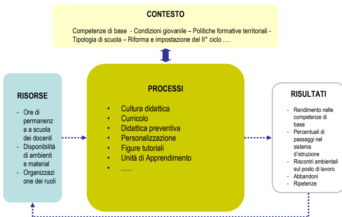
Figura 3 – Modello di ricerca valutativa e indagine RESFOR

Tenendo conto del modello generale di ricerca valutativa e della strategia d'indagine messa in atto, si è deciso di focalizzare l'attenzione su informazioni di contesto, di processo e di risorse, escludendo la raccolta e l'analisi di misure di risultato. Quanto deciso è riportato nella Figura 3.