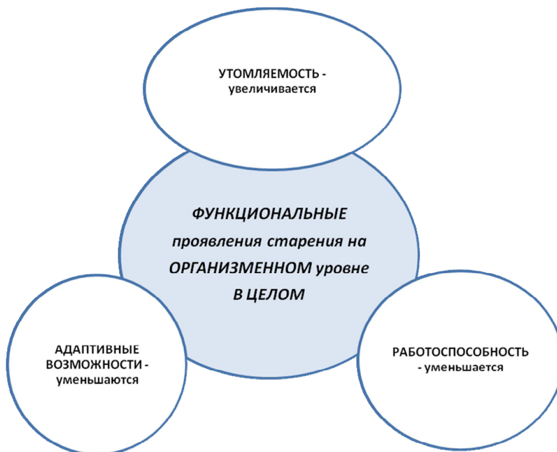
Рис. 3. Функциональные изменения при старении на организменном уровне