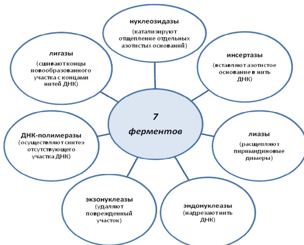
Рис. 4. Ферменты, обеспечивающие репарацию ДНК