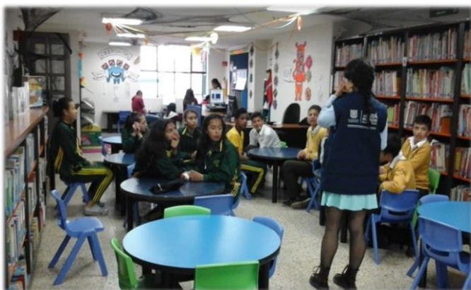
Biblioteca Pública Francisco José de Caldas