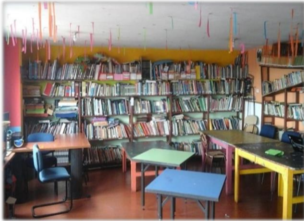
Biblioteca Comunitaria Saturnino

Con respecto a la fundación de las casas de la cultura, el señor Eder Cuadrado expuso que la administración del Alcalde de Bogotá Antanas Mockus (1991-1993) apoyó la creación de estos espacios pues su propósito era formar ciudad a través de la cultura.