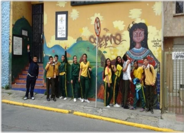
Casa de la Cultura Suba-Centro

Para Cuadrado, “ el reconocimiento del territorio se realiza a partir de conversatorios y recorridos dirigidos a colegios, con el fin de visitar y reconocer el acontecer histórico de la localidad ” (Anexo 13).