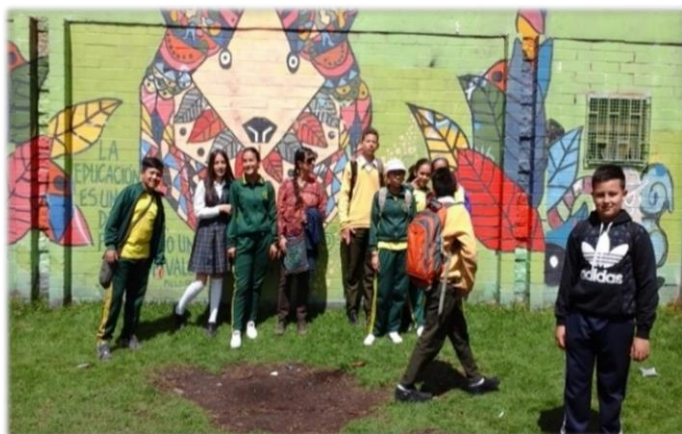
Centro de Educación Popular Chipacuy

El Centro de Educación Popular Chipacuy, ubicado en el sector de Suba Compartir, fue otro referente importante en la localidad por su actividad educativa y cultural. Este espacio fue visitado por los estudiantes de curso 701 en compañía de la docente.