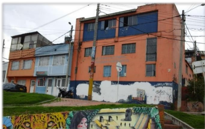
Casa de la Cultura Ciudad Hunza

Suba cuenta con tres casas de la cultura: Suba-Centro, El Rincón y Ciudad Hunza, esta última ubicada en el Cerro Sur de la localidad, donde también se encuentra la Biblioteca Comunitaria Saturnino Sepúlveda. (Anexo 12).