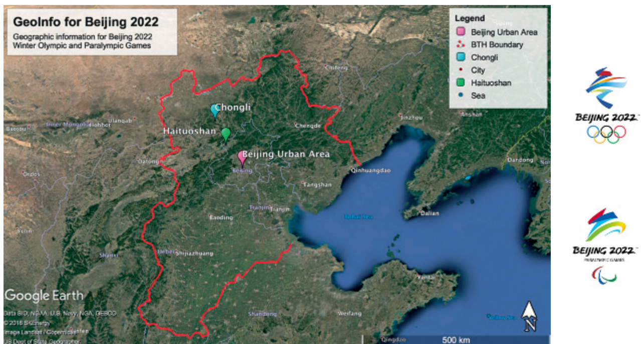
Figura 1. Situación de las tres zonas deportivas. La línea roja continua indica el límite de la región Pekín-Tianjin-Hebei (PTH) (figura generada con Google Earth Pro).

El programa de observación desarrollará también reanálisis de alta resolución y modelos conceptuales de fenómenos meteorológicos de pequeña escala en las dos zonas montañosas, a partir de medidas de varios sensores, asimilación e integración de datos de alta resolución y simulaciones numéricas especiales (por ejemplo, simulaciones de turbulencia y modelos numéricos de dinámica de