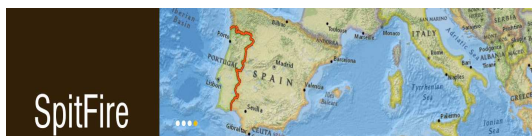
Fig.1.-Logo del proyecto SpitFire ( http://firehelp.wix.com/spitfire ).

Spitfire es un proyecto cofinanciado por la Comisión Europea y que cuenta con la colaboración de un grupo de diversas entidades con décadas de experiencia en análisis de comportamiento de incendios forestales, cálculo de riesgos y su aplicación a la prevención, preparación y operación. Se incluyen autoridades públicas como la Agencia Estatal de Meteorología Española (AEMET), la Autoridad Nacional de Protección Civil Portuguesa (ANPC), el Servicio Meteorológico Portugués (IPMA), así como entidades privadas tales como la empresa española METEOGRID y la Asociación por el Desarrollo de la Industria Aerodinámica Portuguesa (ADAI).