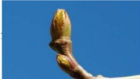
Figura 2. Estado de las yemas florales el 6 de marzo. Imagen obtenida Ciudad Universitaria.

La situación meteorológica estuvo caracterizada por unos días soleados y cálidos que se interrumpieron bruscamente el día 17 por una situación lluviosa y fría. Los pronósticos del ECMFW sufrieron muchos cambios según se iba aproximando el cambio de tiempo. En Getafe, el sábado 8 de marzo se pronostica para el 13 de marzo la superación del umbral del PAC y la fecha se va adelantando primero, y retrasando después. En Retiro, el lunes 10 de marzo se prevé por primera vez la superación del umbral el sábado día 15, aunque las posteriores predicciones lo sitúan siempre en el día 14 (Figura 1).