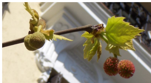
Figura 4. Estado de las inflorescencias el día 15 de marzo, en los árboles del paseo Reina Cristina (Madrid, Retiro). Inflorescencias masculinas verde-amarillentas a punto de emitir el polen e inflorescencias femeninas rojiza y de mayor tamaño.