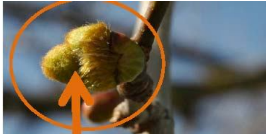
Figura 3. Estado de gran parte de las yemas florales el 12 de marzo. Emergen las inflorescencias, que son esféricas, pedunculadas y cuando maduras miden de 0,8-1 cm de diámetro. Imagen obtenida en Ciudad Universitaria.