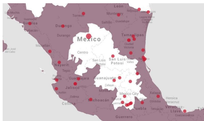
Figura 1. Mapa de Endemismo del vector Aedes aegypti . ( http://www.cdc.gov/dengue/ )

En la zona central de México existe una barrera natural que interviene con un efecto directo o indirecto sobre la presencia del vector, la Sierra Madre Oriental, misma que ya actúa como una barrera climática al vector.