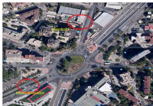
Figura 1. Localización del edificio de Iberdrola (N) y del Intercambiador (SW) en la Plaza Elíptica.

el lado Norte (Edificio Iberdrola) a una altura de unos 14.5 m sobre el suelo, de la que se calcularon promedios diez-minutales de la velocidad y dirección del viento, temperatura, humedad relativa, presión, precipitación y radiación solar descendente. Por otro lado en la zona sur de la plaza (Intercambiador) de instalaron los dos anemómetros sónicos a 6 y 8 m sobre el suelo que registraron las tres componentes del flujo atmosférico ( u , v , w ) así como la temperatura del aire a una tasa de muestreo de 20 Hz.