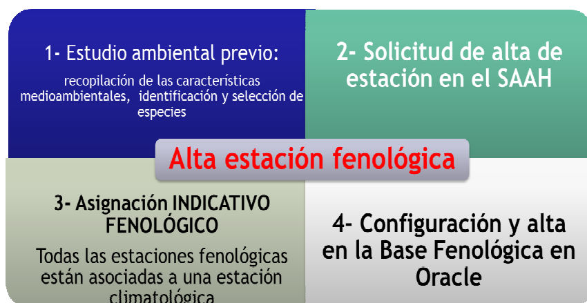
Fig. 4 Información recopilada previamente a la incorporación de una estación fenológica a la BDF de la AEMET.

Con el objetivo de aumentar la calidad de las observaciones fenológicas y fomentar el uso de las nuevas tecnologías para la captación y archivo de datos en la nueva BDF, se han impartido cursos de formación para el personal de la AEMET. Éstos han facilitado que en los tres últimos años se hayan iniciado las observaciones fenológicas en el entorno de los siguientes Observatorios principales de la AEMET: Guadalajara (que posee un jardín para observaciones fenológicas), Igueldo, Izaña, Ciudad Real, Navacerrada, Daroca, Cáceres, Badajoz y Albacete.