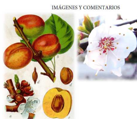
Fig. 5 Ficha de observación de Prunus armeniaca con la descripción de estadios, obtenida de un cuaderno de campo elaborado por el Servicio de Aplicaciones Agrícolas e Hidrológicas de la AEMET.