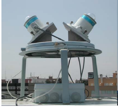
Figura 1. Dispositivo experimental para la medida de la UVER sobre planos inclinados.