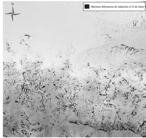
Figura 2 – La figura de la izquierda es el DEM de 20 metros de Huéneja. En la imagen de la derecha se ha superpuesto sobre el DEM una máscara con las zonas donde existe una mayor diferencia de estimación de radiación global.