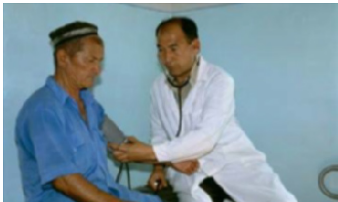
Un paciente recibe tratamiento en Tayikistán.

especialistas en temas respiratorios y cardíacos del probable aumento de casos durante períodos específicos, preparar las farmacias para que tengan a mano una cantidad adecuada de medicamentos esenciales, y alertar a los pacientes de alto riesgo y al público en general para que modifiquen su comportamiento con tal de evitar la exposición a la mala calidad del aire.