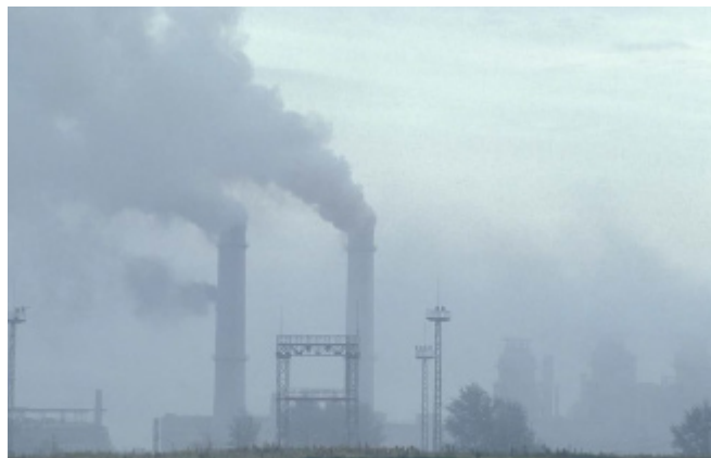
Chimeneas en una ciudad industrial en Estonia.

La calidad del aire y la salud humana son una prioridad para las acciones conjuntas. La comunidad meteorológica genera una amplia gama de datos, productos y servicios que son instrumentos esenciales para la comunidad sanitaria para promover con eficacia políticas que protejan a las personas, y que pongan en marcha acciones que puedan evitar enfermedades y muertes debidas a la mala calidad del aire. Está aumentando de forma constante la toma de conciencia sobre aplicaciones potenciales de la vigilancia, la modelización y la predicción del tiempo y del clima para la salud. La publicación en 2012 del Atlas del Clima y la Salud de la OMM/OMS estimuló el interés público y científico. La nueva Oficina Conjunta OMS/OMM para el Clima y la Salud ayudará aún más a crear conciencia, fomentar la capacidad y fortalecer las asociaciones adecuadas para abordar esta cuestión. Existe un potencial en todo el mundo para mejorar la transferencia y el uso de los productos meteorológicos y climáticos disponibles. Sin embargo, se necesitan más medidas para mejorar el diálogo y catalizar asociaciones entre profesionales de la salud y de la meteorología en los niveles mundial, regional, nacional y metropolitano.