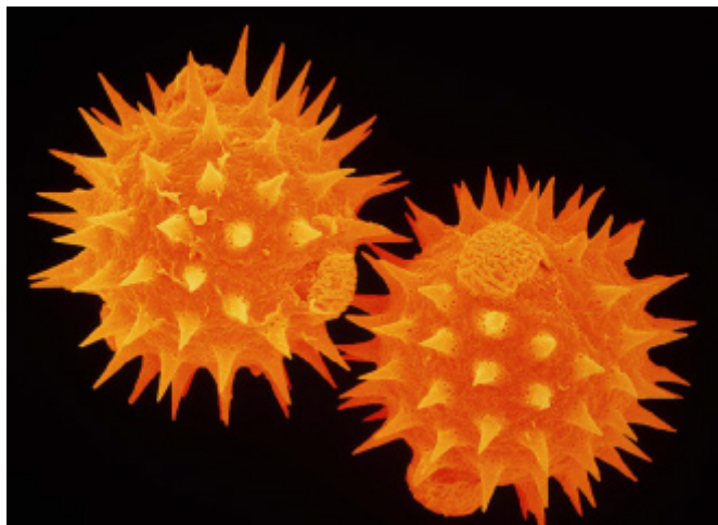
Imagen coloreada de microscopio electrónico del polen procedente de la familia de los girasoles. Dependiendo del tiempo y del clima los pólenes pueden permanecer suspendidos en el aire durante horas, y causar brotes de alergia lejos de sus fuentes en cualquier momento del día.

y arena y el smog urbano durante las olas de calor. Sin embargo, la exposición a largo plazo a niveles elevados de contaminación del aire con el paso del tiempo puede dar lugar a mayores efectos en la salud que las exposiciones puntuales. Las partículas contaminantes finas, el ozono, el monóxido de carbono, los dióxidos de nitrógeno y azufre, y los aeroalérgenos son los principales contaminantes atmosféricos que afectan a la salud humana.