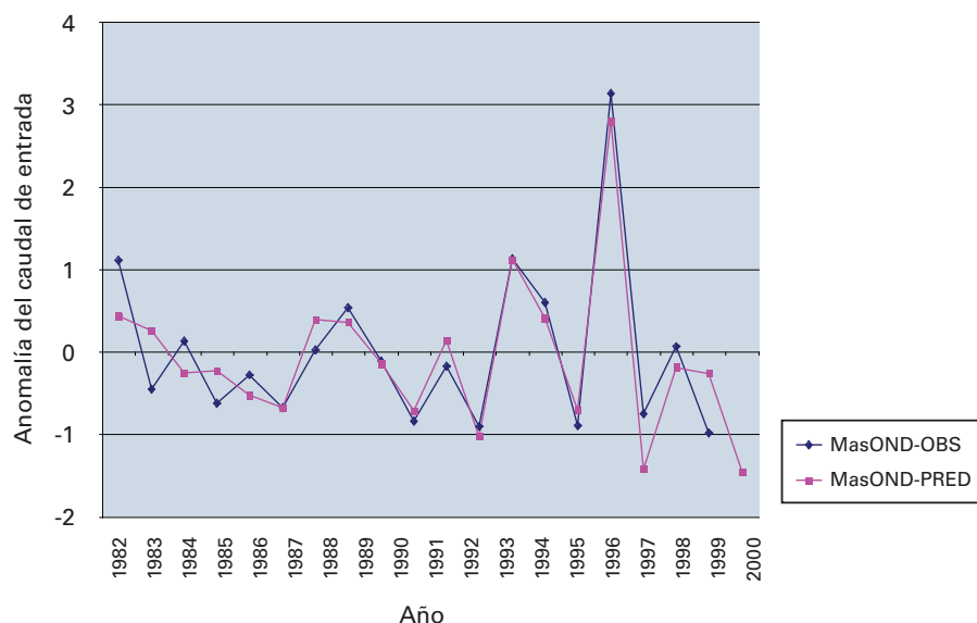
Figura 2 — Presa de Masinga y comparación entre las anomalías del caudal de entrada observado y previsto para el período octubre-noviembre-diciembre (OND)

Desde el año 2001, cuando el sector sanitario comenzó a participar de forma activa en los Foros sobre la evolución probable del clima (COF), el Ministerio de Sanidad de Kenia ha utilizado de forma óptima la información climática periódica publicada por el ICPAC y por el Departamento Meteorológico de Kenia (DMK).