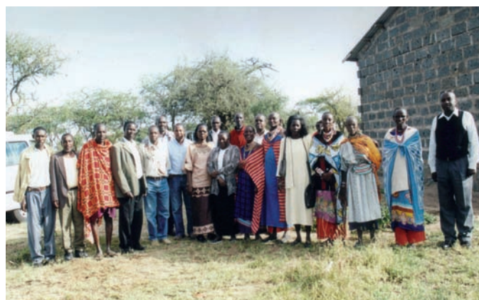
Figura 3 — Difusión de las proyecciones climáticas estacionales a través de grupos locales de estudiantes y grupos de mujeres