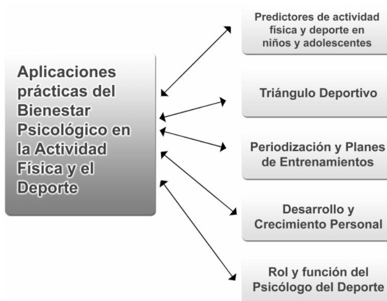
Figura 3. Aplicaciones prácticas del bienestar psicológico en la actividad física y el deporte

el futuro, autovaloración de la aptitud deportiva, forma física percibida y salud percibida predicen positivamente tanto en chicos como en chicas, la práctica del deporte y la práctica del ejercicio físico intenso. De todas maneras se hace necesario evaluar el bienestar realizando diferencias de género, ya que como se ha indicado en otros estudios (Brustad, 1996) las diferencias podrían ser sustanciales (ver Figura 3).