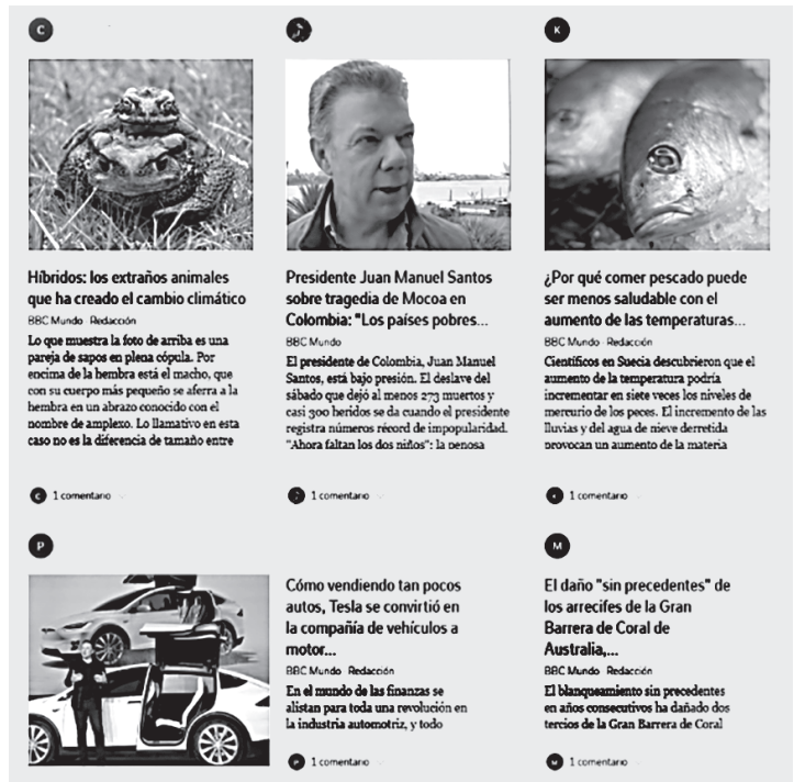
Figura 1. Ejemplo de la revista de Flipboard

Además, ahora se está expandiendo al mercado en español (Cruz, 2014) lo cual resulta de gran utilidad para el cometido de este proyecto. Así, una vez instalado, con tan solo hacer clic en el botón del margen superior se puede flippear 1 , agregar a favoritos o compartir en las redes sociales o por correo electrónico. Igualmente, se puede leer no solo el título sino las primeras líneas del artículo en cuestión y ver la imagen que las acompaña.