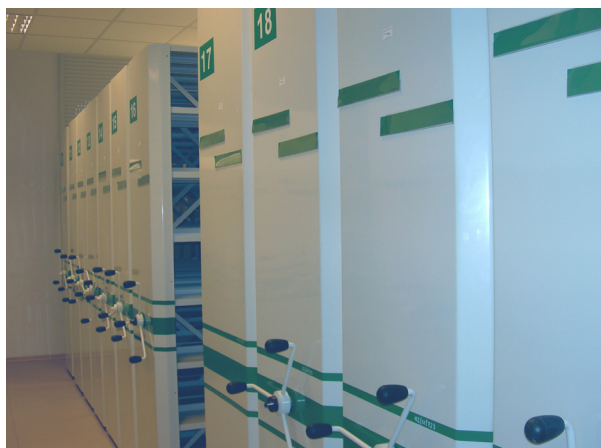
Rys. 2. Regały kompaktowe w magazynie bibliotecznym

Jedną z ciekawszych interpretacji wyników jakości mikrobiologicznej powietrza, łączącą stężenia bioaerozoli z obecnością wewnętrznych źródeł mikroorganizmów, opublikowali Brokerhof i wsp. [3] na podstawie wieloletnich badań i obserwacji przeprowadzanych przez National Archives of the Netherlands. W pomieszczeniach