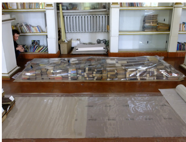
Rys. 3. Dezynsekcja w zmodyfikowanej atmosferze (zawartość tlenu < 0,5\% ); na pierwszym planie folia, na której układają się książki przeznaczone do dezynsekcji, na drugim planie wypełniona azotem komora foliowa z książkami w trakcie dezynsekcji

Zalecenia dotyczące ochrony zbiorów na podłożu papierowym przed mikroorganizmami i owadami podlegają w ciągu ostatnich lat istotnym zmianom. Polegają one głównie na ograniczeniu dezynfekcji i dezynsekcji metodami chemicznymi (ETO) lub fizycznymi (promieniowanie gamma) do wyjątkowych przypadków silnego porażenia. Obecnie kładzie się nacisk na utrzymanie prawidłowych zakresów parametrów mikroklimatu, w tym temperatury, wilgotności względnej powietrza i wentylacji oraz czystości w magazynie. Częste przeglądy zbiorów oraz monitoring mikroorganizmów i owadów, czyli badania stężeń bioaerozoli i stosowanie pułapek monitorujących przeciw owadom, ułatwiają wczesne wykrycie ich ataku. W celu zwalczania