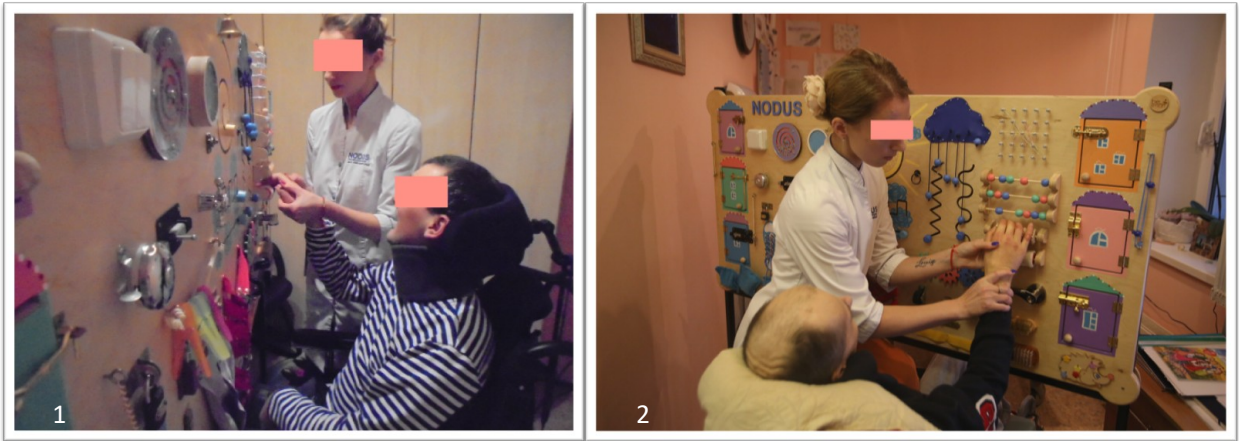
Рис. 1. Сеанс нейропсихологічної корекції, когнітивно-поведінкова терапія, робота на Busy board (бізіборді) при допомозі психіатра у пацієнтів групи А (1) та групи Б (2).

фото 1 – спостереження №131; фото 2 – спостереження №194