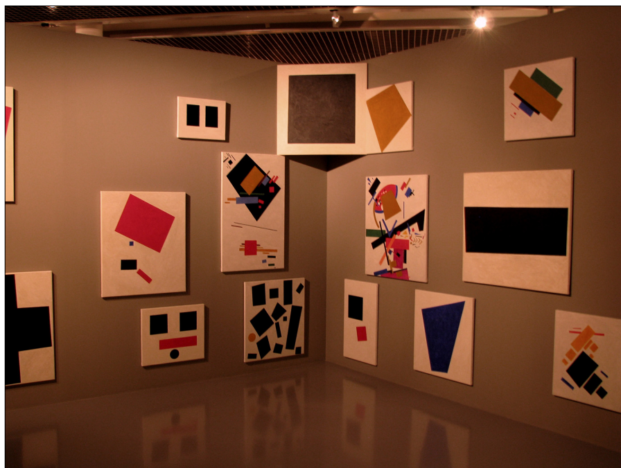
Il. 7. Sala Malewicza na wystawie 0,10 ostatnia wystawa futuryzmu, Piotrograd, rekonstrukcja (1915/2014), Muzeum Sztuki w Łodzi