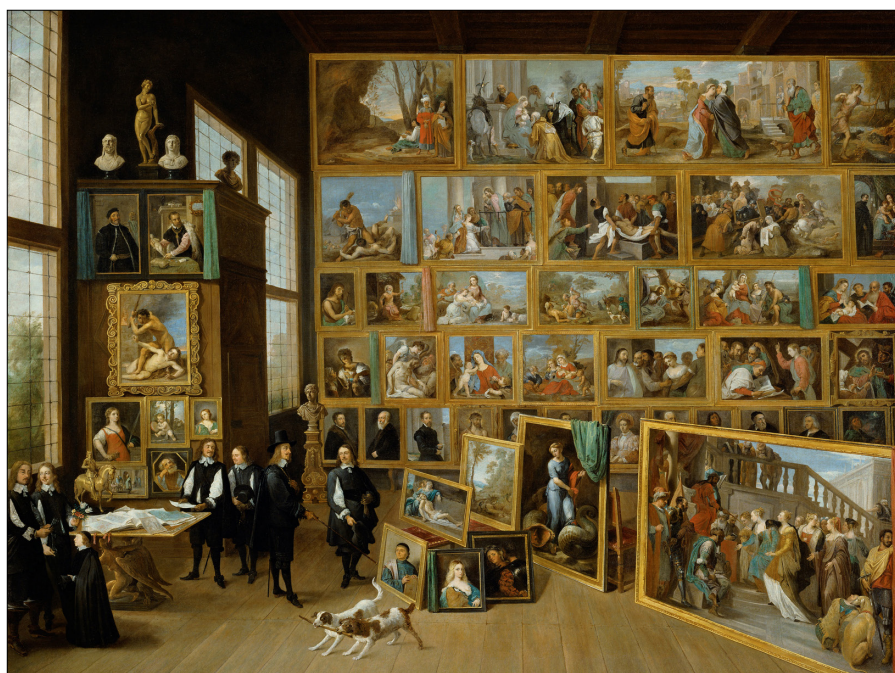
Il. 2. David Teniers Mł., Galeria arcyksięcia Leopolda Wilhelma w Brukseli, (1651–1653), Kunsthistorisches Museum, Wiedeń (29.03.2014: http://upload.wikimedia.org/wikipedia/commons/f/fa/DAVID_TENIERS_EL_JOVEN_-_El_Archiduque_Leopoldo_Guillermo_en_su_Galer%C3%ADa_de_Bruselas_%28Kunsthistorisches_Museum_de_Viena%2C_1650-52._%C3%93leo_sobre_lienzo%2C_123_x_163_cm%29.jpg )