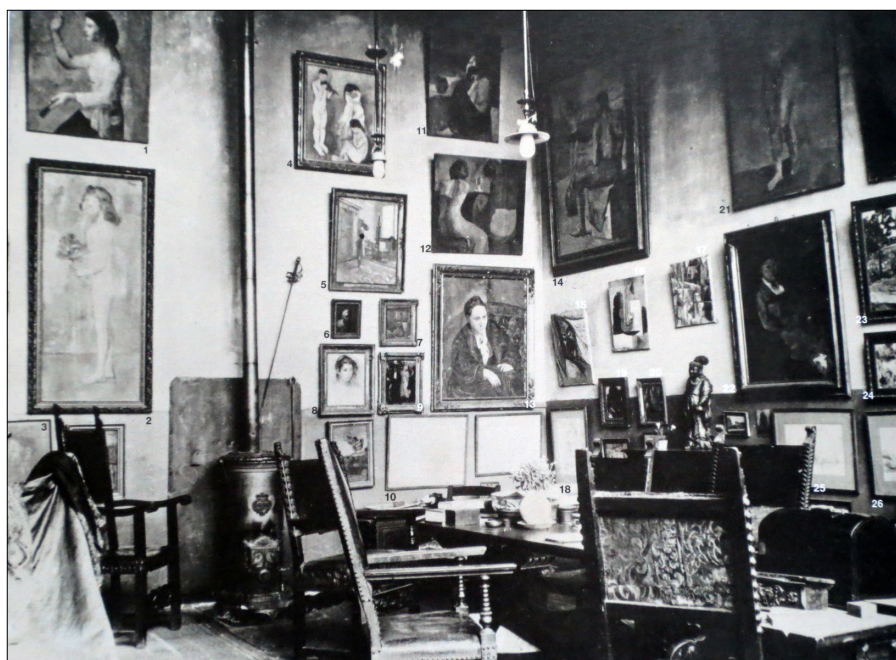
Il. 4. Wnętrze mieszkania Gertrudy i Leo Steinów przy rue Flerus nr 27 w Paryżu, 1912–1913