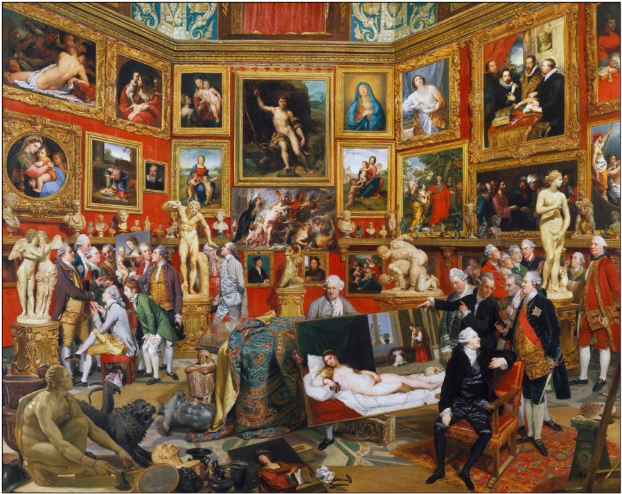
Il. 1. Johann Joseph Zoffany, Trybuna w Uffiziach, (1772–1778), Royal Collection, Windsor (29.03.2014: http://upload.wikimedia.org/wikipedia/commons/8/83/Johan_Zoffany_-_Tribuna_of_the_Uffizi_-_Google_Art_Project.jpg )