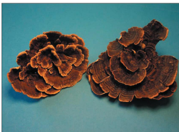
Ryc. 1. Wyszuszony Coriolus versicolor [7]

Bardzo istotną właściwością PSP jest jego znikoma toksyczność. Stężenie tego preparatu, stosowanego u ludzi w terapii wspomagającej leczenie nowotworów na ogół nie przekracza 1 g (gdy przyjmowany jest trzy razy dziennie) [20,42], podczas gdy najwyższa dzienna dawka, przy