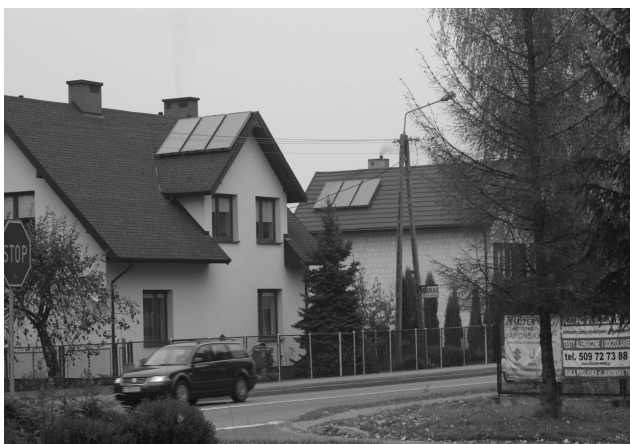
Fotografia 3. Kolektory słoneczne w „obszarze turystycznym Dolina Zielawy”, Rossosz

śnie przesłanki techniczne warunkują to, że kolektory słoneczne w największym stopniu instaluje się na nowych budynkach mieszkalnych (fot. 3).