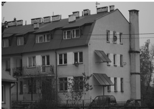
Fotografia 2. Kolektory słoneczne w „obszarze turystycznym Dolina Zielawy”, NZOZ Ośrodek Zdrowia w Podedwórze

Instalacja kolektorów słonecznych zawarta w projekcie „obszar turystyczny Dolina Zielawy” obejmować będzie ponad 4 tys. osób w indywidualnych gospodarstwach domowych (tj. 25,2% ogólnej liczby ludności w badanych gminach) i ponad 2 tys. w instytucjach publicznych (fot. 2), tak iż w latach 2011 – 2012 zostanie zamontowanych docelowo 848 zestawów tych instalacji, tj. od dwóch do kilku kolektorów. Liderem w tym względzie wśród analizowanych gmin jest gmina Wisznice z udziałem wynoszącym ponad 35% wszystkich zestawów słonecznych, a następnie gmina Jabłoń (25%). Pozostałe trzy gminy (Podedwórze, Rossosz i Sosnowkę) będą mieć docelowo 40% tych zestawów ( www.dolnazielawy.pl/ 24.10.2011).