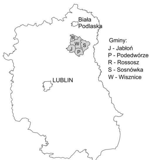
Rysunek 1. Lokalizacja gmin wiejskich tworzących „obszar turystyczny Dolina Zielawy” w województwie lubelskim

Chcąc zintensyfikować działania na rzecz rozwoju turystyki władze samorządowe pięciu gmin województwa lubelskiego (Jabłoń, Podedwórze, Rossosz, Sosnówka, Wisznice) podjęły współpracę mającą na celu promocję kultury i turystyki na „obszarze turystycznym Dolina Zielawy” (ryc. 1). Działania te wspomagane środkami finansowymi pochodzącymi z Europejskiego Funduszu Rozwoju Regionalnego nabierają obecnie znaczącej dynamiki.