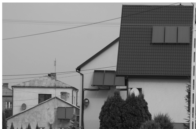
Fotografia 1. Kolektory słoneczne w „obszarze turystycznym Dolina Zielawy”, Wisznice

Wykorzystanie odnawialnych źródeł energii, w tym energii słonecznej, zyskuje na omawianym obszarze na coraz większym znaczeniu. W gminach tworzących „obszar turystyczny Dolina Zielawy” kolektory słoneczne pojawiły się już w 2008 r. wprowadzając tym samym różnorodność krajobrazową. Wypada tu nadmienić, że ze względu na formę, kształt i rozmiar bardziej widocznymi w krajobrazie są farmy wiatrowe czy pojedyncze turbiny wiatrowe, ale instalacje słoneczne są bliżej użytkownika energii, co więcej ze względu na rozmach inwestycji wpływają na taką, a nie inną percepcję krajobrazu (fot. 1).