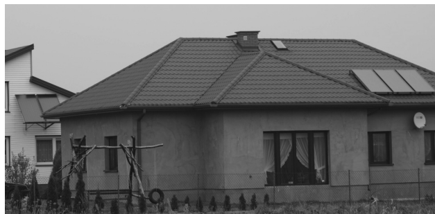
Fotografia 4. Kolektory słoneczne w „obszarze turystycznym Dolina Zielawy”, Wisznice

Biorąc pod uwagę uwarunkowania demograficzno-społeczne (strukturę wieku mieszkańców i źródeł utrzymania) stanowiące m.in. o inwencji oraz zaradności, także ekonomicznej, mieszkańców oraz te związane ze stanem technicznym i wyposażeniem budynków mieszkalnych, nie dziwi fakt, że najwięcej instalacji słonecznych przypadło gminie Wisznice (ponad 35% wszystkich zestawów tych instalacji) (fot. 4).