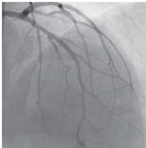
Rycina 2. Końcowy efekt pierwotnej angioplastyki wieńcowej