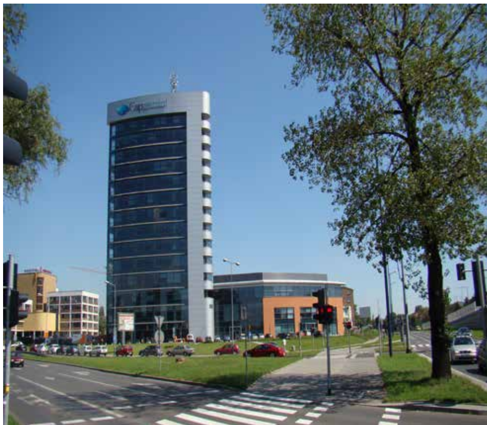
Fot. 2. Obszar strategiczny Olsza: widok na biurowiec i fragment zabudowy biurowo-biznesowej zespołu Rondo Business Park oddanego do użytku w 2008 roku

Powyższe okoliczności zasadniczo zdecydowały o lokalizacji inwestycji charakteryzujących się szczególną złożonością obrazu funkcjonalnego. Należy tu podkreślić, że do drugiej połowy lat 90. XX wieku, większą część tego obszaru zajmowały tereny rolne (od strony wschodniej). W części środkowej zlokalizowane były obiekty Miejskiego Przedsiębiorstwa Robót Inżynieryjnych, które po likwidacji tworzą rozległy ugor przemysłowy. W zachodniej części dominował natomiast 5-kondygnacyjny biurowiec państwowego przedsiębiorstwa Budostal 2, obecnie, po renowacji wynajmowany jest na cele biurowe. W tej części, w odnowionych obiektach znalazła także siedzibę Komenda Straży Miejskiej Miasta Krakowa (od 1997), Archiwum Miasta Krakowa oraz kilkunaście placówek handlowo-usługowych i warsztatów samochodowych.