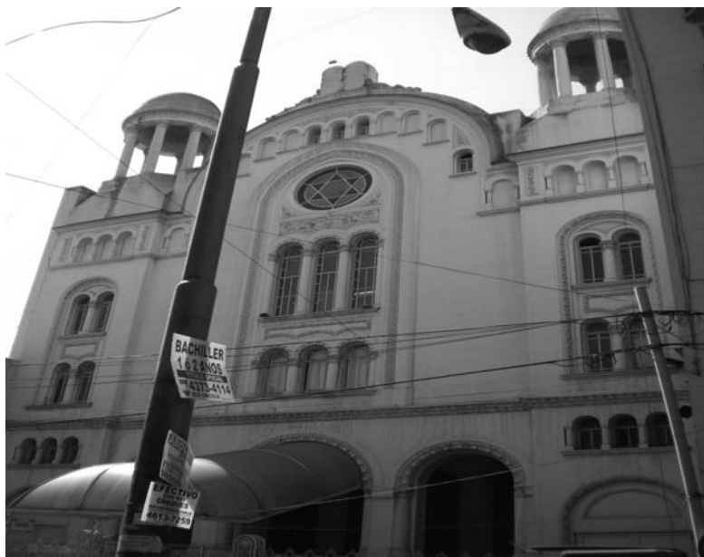
Fotografia 4. Synagoga reformowana w dzielnicy Once w Buenos Aires